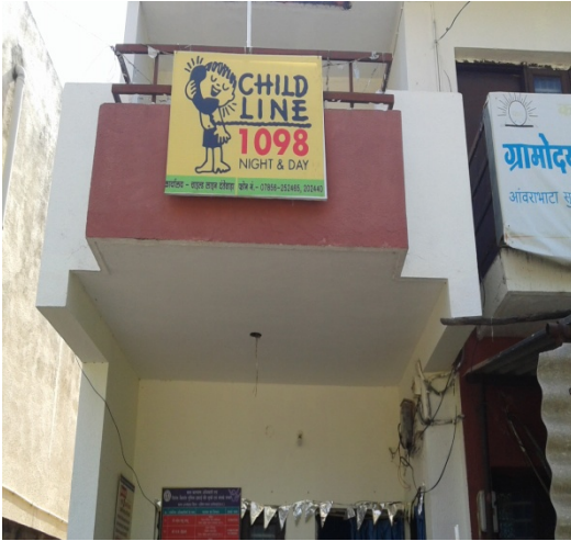
(चाईल्ड लाईन कार्यालय)

चाईल्डलाईन ऐसे बच्चों के लिए कार्य करती है जिनको देखभाल एवं संरक्षण की आवश्यकता हो।