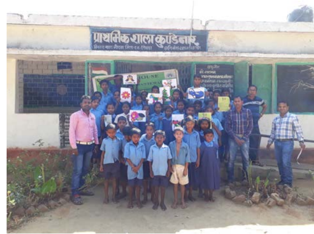
(ओपन हाऊस कोण्डेनार)

ओपन हाँस:-ओपन हाँस में अभिनय एवं वक्तव्य के माध्यम से चाईल्ड लाईन 1098 की सेवा ( जैसे- बाल विवाह , गुमशुदा, घर से भागे, बाल श्रमिक, यौन शोषण, अनाथ बच्चे भिक्षावृति आदि में संलग्न बच्चों के संरक्षण ) के बारे में विस्तार पूर्वक जानकारी दिया जाता है व बच्चों की समस्याओं के बारे में जानकारी लिया जाता है।